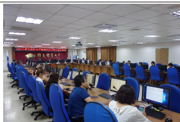
校務自我評綜合座談會議--委員提出意見