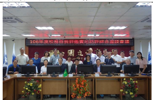
校務自我評綜合座談會議--全體大合照