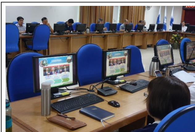
校務自我評鑑簡報會議--評鑑委員聽取簡報