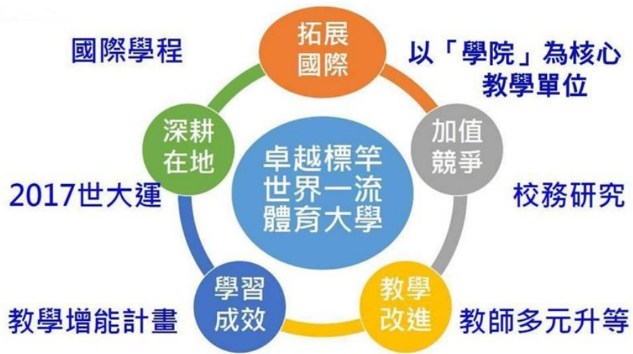
圖 2-3 近期之教育計畫目標圖