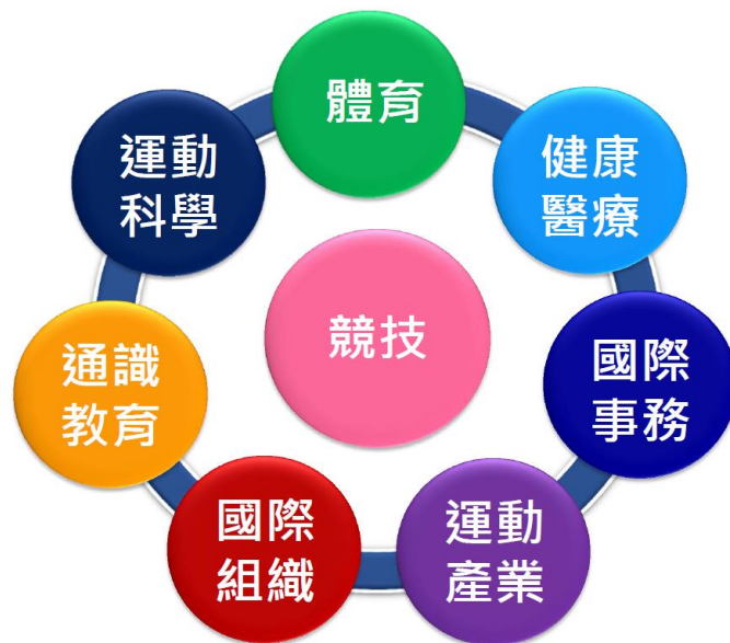
圖 2-4 國立體育大學系統性支持運動競技發展圖

體育大學系統是現今的國際趨勢，為因應體育高等教育及國際運動競技發展，歐美國家陸續增設體育大學，體育大學系統不僅成為引領體育高等教育的領頭羊，亦成為奧運奪牌的火車頭。本校具備連結師資、教練、課程、設備、環境等要素，以及連結校內院系所的能量，以建構完整的運動組訓能量之能力，系統性支持運動競技發展(請參見圖 2-4)。可以兼具運動訓練中心功能，增加國家訓練能量，避免一般大學「有學籍，沒組訓」之亂象，或是國家訓練中心提供體育學系學生選手訓練場所，但卻無法釐清訓練績效責任之困擾。